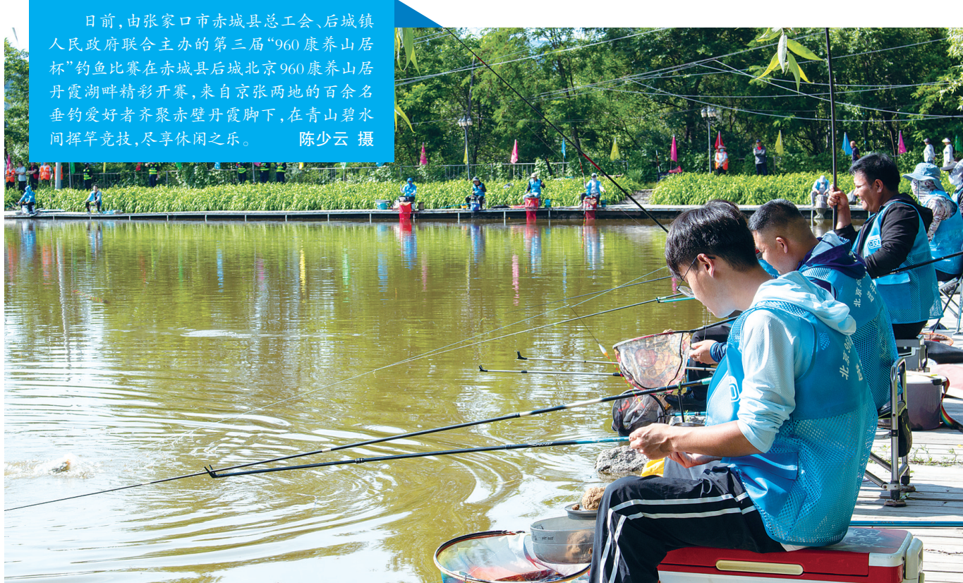
日前,由张家口市赤城县总工会、后城镇人民政府联合主办的第三届“960康养山居杯”钓鱼比赛在赤城县后城北京960康养山居丹霞湖畔精彩开赛,来自京张两地的百余名垂钓爱好者齐聚赤壁丹霞脚下,在青山碧水间挥竿竞技,尽享休闲之乐。

在热线端,完成“12348”公共法律服务热线与“12345”政务服务热线的整合融合,并择优组建“青年律师公共法律服务团”全天候值守,充分发挥青年律师专业精、响应快、服务优的优势,为未成年人提供不间断的免费维权指导,截至目前,热线累计接听来电6705通,其中涉及校园欺凌、家暴、遗弃等未成年人权益保护相关问题咨询503通。