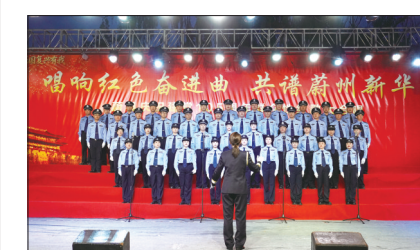
日前,“唱响红色奋进曲·共谱蔚州新华章”群众性红歌大合唱展演首场活动在蔚县古城文庙公园大舞台启幕,全县干部群众在红色歌声里传承红色基因,凝聚起共建美好蔚州的奋进力量。

此外,该行积极探索“金融+文旅”跨界融合新模式,于6月19日至21日在“张家口银行”宣化星空露营地嘉年华活动现场设置特色宣传展位,围绕数字反诈、个人征信保护等内容,开展沉浸式宣教,把金融知识送到群众身边。