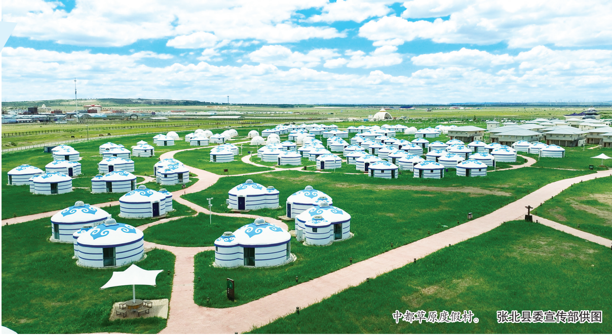
中都草原度假村。

深耕资源优势,赋能产业提质。近年来,张北县持续完善文旅基础设施,优化产业布局,目前已建成23处旅游景点景区,拥有3个国家4A级旅游景区、5个国家3A级旅游景区、1个国家2A级旅游景区,乡村旅游蓬勃发展,多个村镇获评国家、省级乡村旅游重点村镇,形成层级清晰、特色互补的全域文旅矩阵。依托核心资源,当地重点打造草原天路、