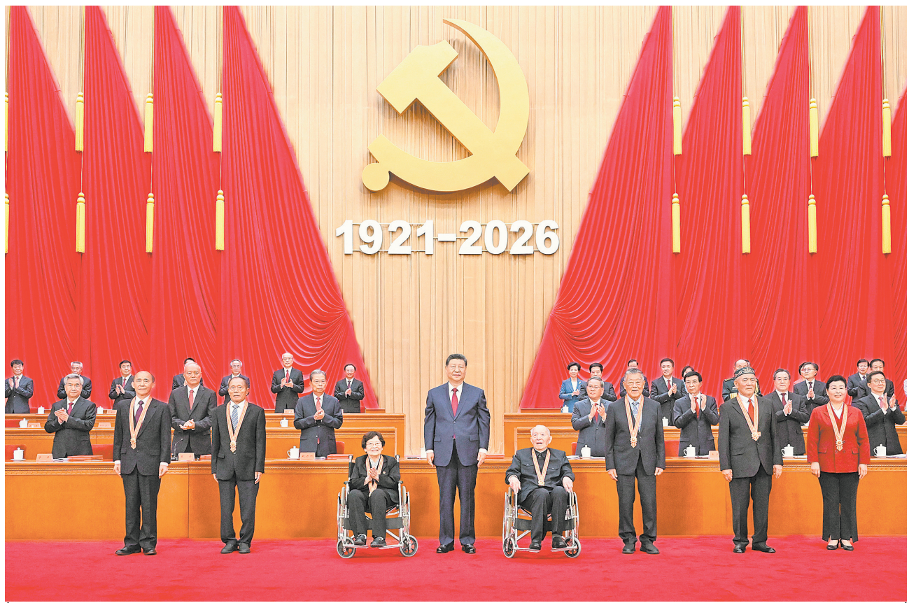
7月1日上午,庆祝中国共产党成立105周年大会在北京人民大会堂隆重举行。中共中央总书记、国家主席、中央军委主席习近平向“七一勋章”获得者颁授勋章。

新华社北京7月1日电 庆祝中国共产党成立105周年大会7月1日上午在北京人民大会堂隆重举行。中共中央总书记、国家主席、中央军委主席习近平向“七一勋章”获得者颁授勋章并发表重要讲话。他强调,105年来,我们党始终坚守为中国人民谋幸福、为中华民族谋复兴的初心使命,在不懈奋斗中创造了彪炳史册的伟大成就。新征程上,全党同志要坚定信心、接续奋斗,不断创造无愧于时代和人民的新业绩。