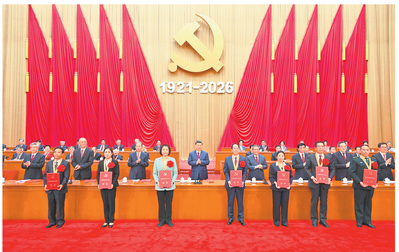
7月1日上午,庆祝中国共产党成立105周年大会在北京人民大会堂隆重举行。这是习近平等党和国家领导人为受表彰的全国“两优一先”代表颁奖。

习近平强调,实现新时代新征程党的使命任务,要求全体中国共产党人坚定信心、接续奋斗,不断创造无愧于时代和人民的新业绩。坚定信心、接续奋斗,必须坚持党的基本理论、基本路线、基本方略,坚持党的全面领导和党中央集中统一领导,深入贯彻新时代中国特色社会主义思想,坚定道路自信、理论自信、制度自信、文化自信,继往开来、守正创新,做到不畏浮云遮望眼、乘风破浪不迷茫。必须紧紧依靠人民创造历史伟业,践行以人民为中心的发展思想,充分激发亿万人民的积极性主动性创造性,统筹推进“五位一体”总体布局、协调推进“四个全面”战略布局,完整准确全面贯彻新发展理念,加快构建新发展格局,扎实推动高质量发展。必须积极应对前进道路上的风险挑战,强化忧患意识、坚持底线思维,发扬斗争精神、增强斗争本领,更好统筹国内国际两个大局,统筹发展和安全。必须持续推动构建人类命运共同体,高举和平、发展、合作、共赢旗帜,弘扬全人类共同价值,推动落实全球发展倡议、全球安全倡议、全球文明倡议、全球治理倡议,为世界和平与发展注入更多正能量。必须持之以恒推进全面从严治党,全面贯彻新时代党建思想,健全全面从严治党体