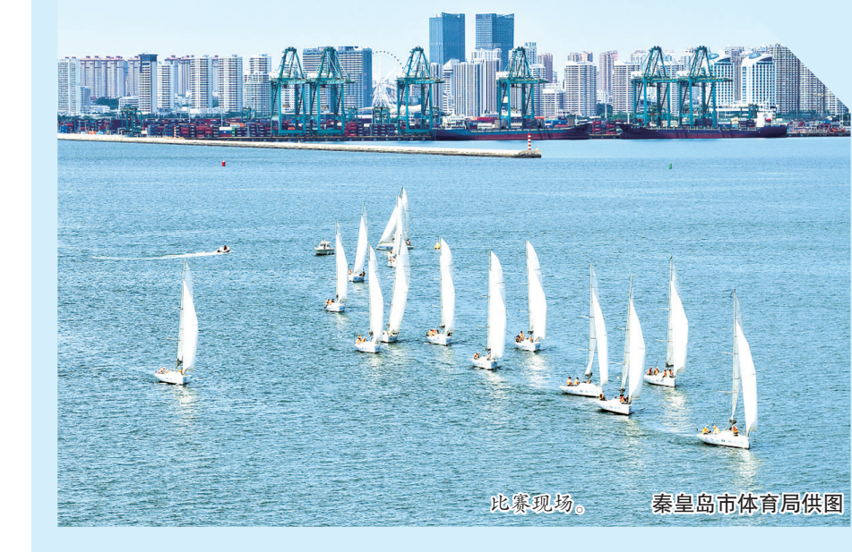
比赛现场。

本报讯(记者祖迪)6月21日,2026中国国家帆船赛·秦皇岛国际旅游港站顺利完赛。本次赛事由中国帆船帆板运动协会主办,河港航海(秦皇岛)体育文化发展有限公司承办,河北港口集团有限公司西港产业园分公司冠名,河北港口集团城市建设发展有限公司支持。