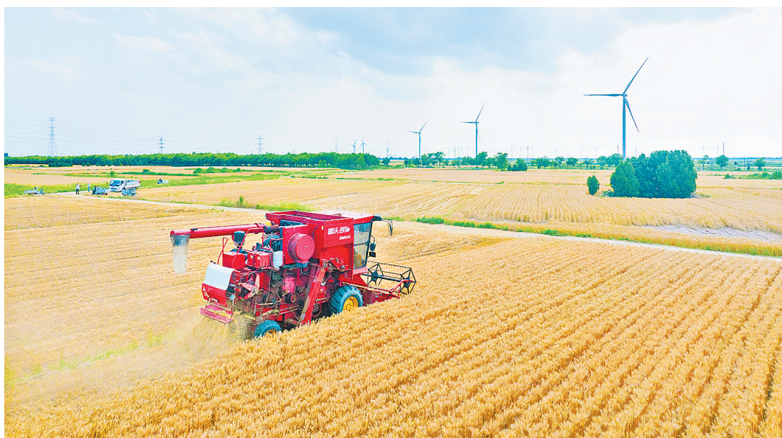
六月四日,在沧州渤海新区黄骅市的麦田里,收割机在收割早碱麦。

延伸金融服务,从单一的收购环节向“产购储加销”全链条覆盖。农发行河北省分行累计支持粮食仓储设施项目21个,金额60.96亿元,新增仓容58.2亿斤,为夏粮收购提供硬件支撑,同时用足用好省级信保基金政策,累计投放信用保证基金收购贷款6.47亿元,有效缓解中小收储主体融资难题。工行河北省分行围绕粮食收储核心企业建立供应链融资链条,设计“聚链e贷”产品,已建立2条产业链,覆盖300余家上下游关联主体。农行河北省分行聚焦83个产粮大县建立常态化监测督导机制,粮食重点领域贷款余额达146.3亿元,较年初增长42.7亿元。河北省农信社通过银政合作联动,与农业农村、粮食储备等部门联合开展“金融服务三夏”专项行动,实现政策协同效应,提高金融服务精准度。