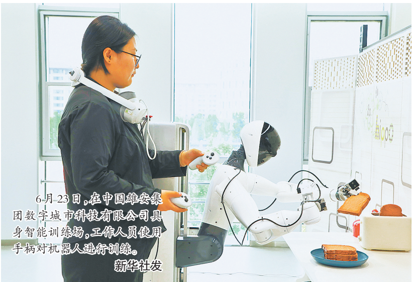
6月23日,在中国雄安集团数字城市科技有限公司具身智能训练场,工作人员使用手柄对机器人进行训练。

到,同一栋楼里,一边是埋头攻坚大模型的研发团队,另一边是调试人形机器人的实体测试场地,算法研发、算力供给、场景落地全链条高度集聚,形成“门对门协作、上下楼联动”的产业格局。