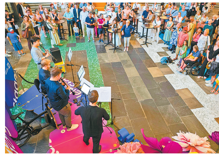
6月21日,在德国柏林爱乐音乐厅,人们观看表演。柏林爱乐音乐厅6月21日举行开放日活动,公众通过公开排练、音乐会、互动体验等活动,近距离了解音乐厅的日常运作,感受音乐魅力。