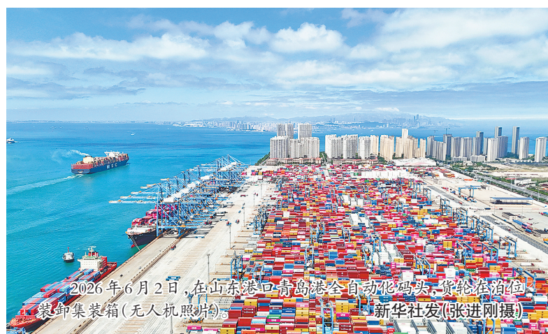
2026年6月2日,在山东港口青岛港全自动化码头,货轮在领航,装卸集装箱(无人机拍摄)

“今年以来,面对全球能源市场大幅波动,我国经济顶住了压力,保持平稳增长,展现出了强大韧性。”国家统计局新闻发言人付凌晖表示。——中观之“进”,在于结构优化。从点到面、从企业到产业,中国经济新动能、新优势不断塑造。投资赛道上,高端装备、智能制造、绿色能源领域热度走高。1至5月份,电子电路制造业、锂离子电池制造业和飞机制造业的投资同比分别增长50.9%、24.9%和19.7%。消费市场上,新能源汽车、高效等级家电、智能产品受青睐。1至5月份,智能可穿戴设备零售额同比增长超