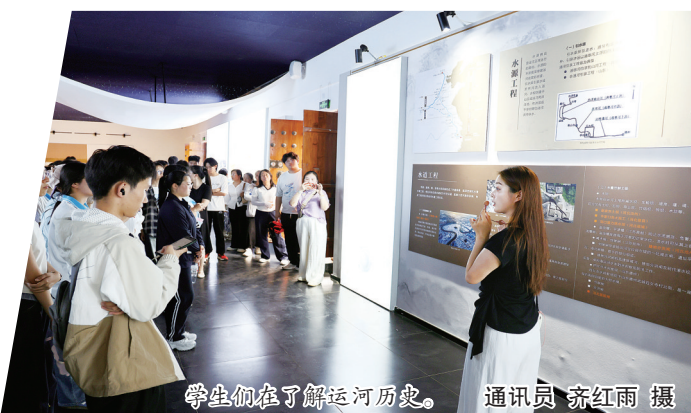
学生们在了解运河历史。

本报(通讯员齐红雨)日前,由共青团故城县委、县文旅集团、县图书馆联合主办的“青春逐梦·寻脉运河”高三学子毕业研学实践活动在故城县大运河畔开展,60余名应届毕业生在运河文脉中告别高中时光,开启人生新篇章。活动在运河传统架鼓表演中拉开序幕。鼓声雄壮,锣声响亮,气势磅礴,学子们也拿起鼓槌参与其中,在热烈氛围中尽