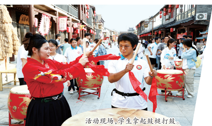
活动现场,学生拿起鼓槌打鼓。