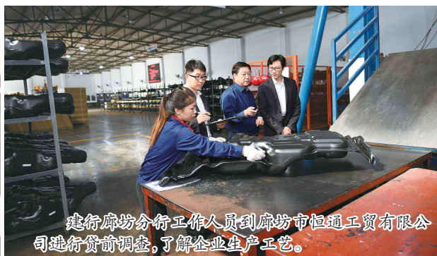
建行廊坊分行工作人员到廊坊市恒通工贸有限公司进行贷前调查，了解企业生产工艺。