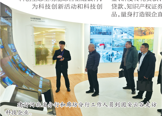
建行河北省分行和廊坊分行工作人员到固安云谷走访科技企业。

科技创新征途如虹，金融服务步履不停。未来，建行廊坊分行将继续深化科技金融服务创新，着力引导金融资源投向实体经济和创新领域，有效推动“科技—产业—金融”良性循环，助力现代化产业体系建设，加快形成新质生产力，全力支持廊坊企业实现高水平科技自立自强，以金融之笔书写科创华章。(曹跃 石继峰)