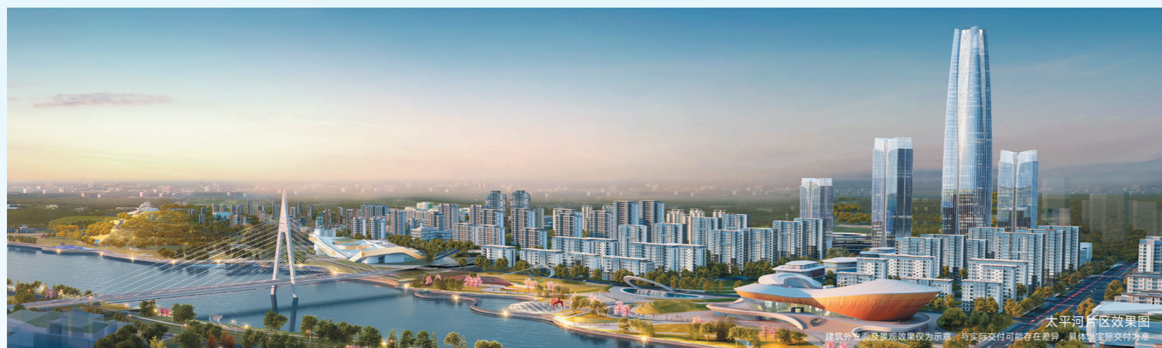
太平河片区效果图

文明伴水而生，人居向水而兴。太平河，正是石家庄版图上一脉如玉的生命之河，它流淌过岁月长卷，镌刻着城市的根脉与记忆，它滋养着一方厚土，承载着时代的繁华与向往，它见证过往，丰盈当下，更以生生不息的力量，奔赴石家庄的璀璨未来。