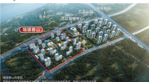
建面约126-218m²宽境森幕奢宅