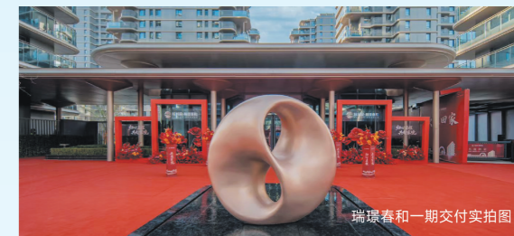
瑞璟春和一期交付实拍图