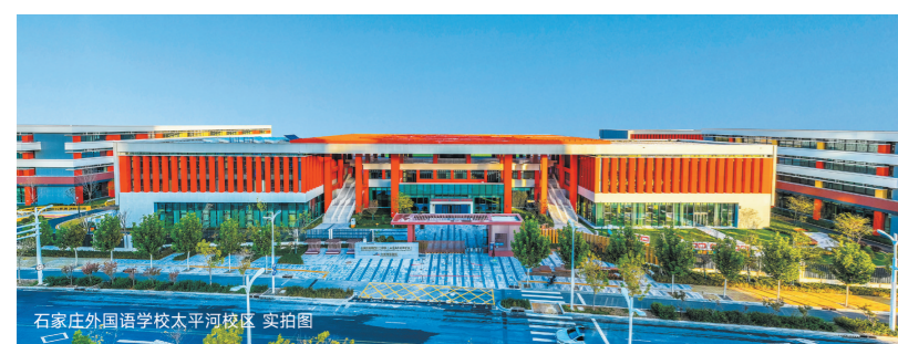
石家庄外国语学校太平河校区 实拍图