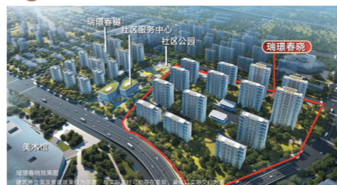
建面约115-140m²全生命周期成长社区