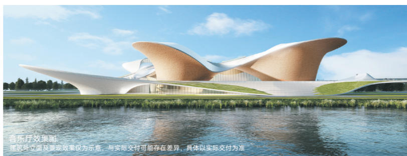
音乐厅效果图 建筑外立面及景观效果仅为示意,与实际交付可能存在差异,具体以实际交付为准