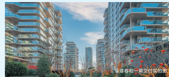
瑞璟春和一期交付实拍图

熙春园酒店式归家大堂,3.0架空层、园林示范区、臻装样板间、工艺工序样板间及安澜府臻装样板间等全维匠心实景,敬呈“不久候”的归家礼遇。