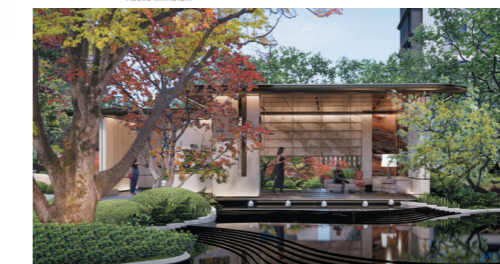
建面约104-139m²都会滨水奢宅