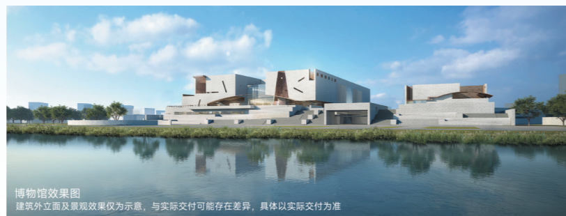
博物馆效果图 建筑外立面及景观效果仅为示意,与实际交付可能存在差异,具体以实际交付为准