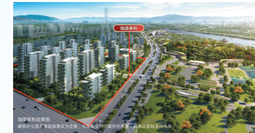
建面约115-251m²静逸山水美宅