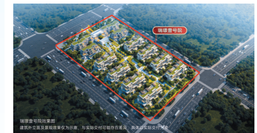
建面约445m²-645m²合院约249m²-440m²叠拼