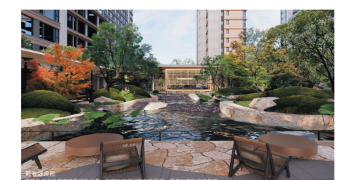
建面约116-146m²诗书水岸奢宅