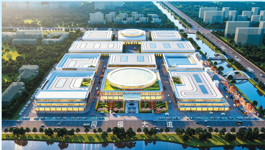
廊坊同福健康产业航母基地。

当前，商贸物流已成为国民经济支柱产业，体量大、链条长、从业群体广、关联产业多，但长期缺少一座国家级、专题化、综合性文化博览平台。5月，国内首座以商贸物流为专题的大型综合性展馆——廊坊国际商贸物流博览中心，在廊坊建成投用，成为廊坊同福健康产业航母基地一期首个落地项目，填补商贸物流行业空白。