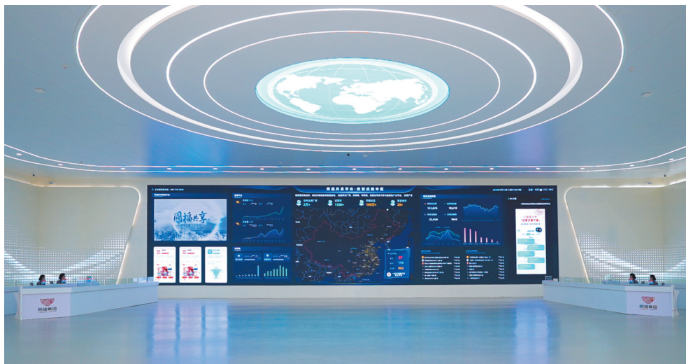
同福共享平台数智大厅。

本届廊坊经洽会，同福共享平台展厅全景呈现廊坊国际商贸物流博览中心文化价值与共享平台科技成果。展示内容通过古今对照视角，以沉浸式、数字化展陈，彰显文化厚度、科技高度、产业广度，充分体现文化站位、商业价值、行业引领三大核心定位。