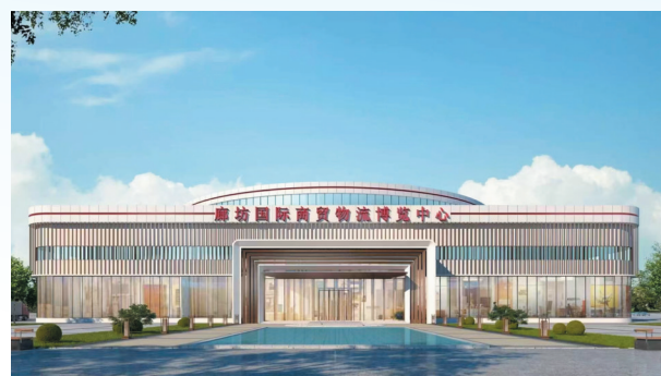
廊坊国际商贸物流博览中心。

本届廊坊经洽会，同福共享平台展厅全景呈现廊坊国际商贸物流博览中心文化价值与共享平台科技成果。展示内容通过古今对照视角，以沉浸式、数字化展陈，彰显文化厚度、科技高度、产业广度，充分体现文化站位、商业价值、行业引领三大核心定位。