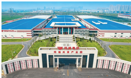
石家庄正定同福共享产业园。

经过近5年探索运营，同福共享平台运营成效显著：联动200余家一线品牌、超2万家合作厂商、1500余家经销商，服务120万余家终端门店，触达超1亿消费者；累计取得600余项专利著作权，估值159亿元，直接间接带动超100万人就业。平台依托供应链、渠道、平台和服务四大能力，形成开放共赢产业生态，推动整个实体消费链路降低配送成本23%、物流总成本35%。