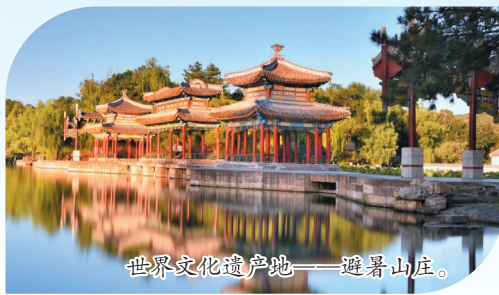
世界文化遗产地——避暑山庄。