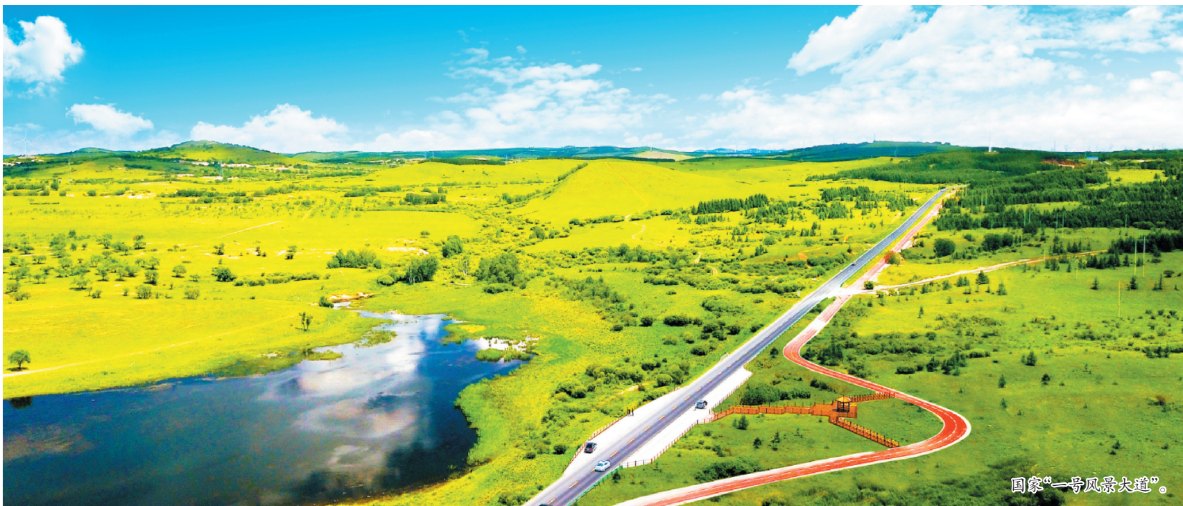
国家“一号风景大道”。