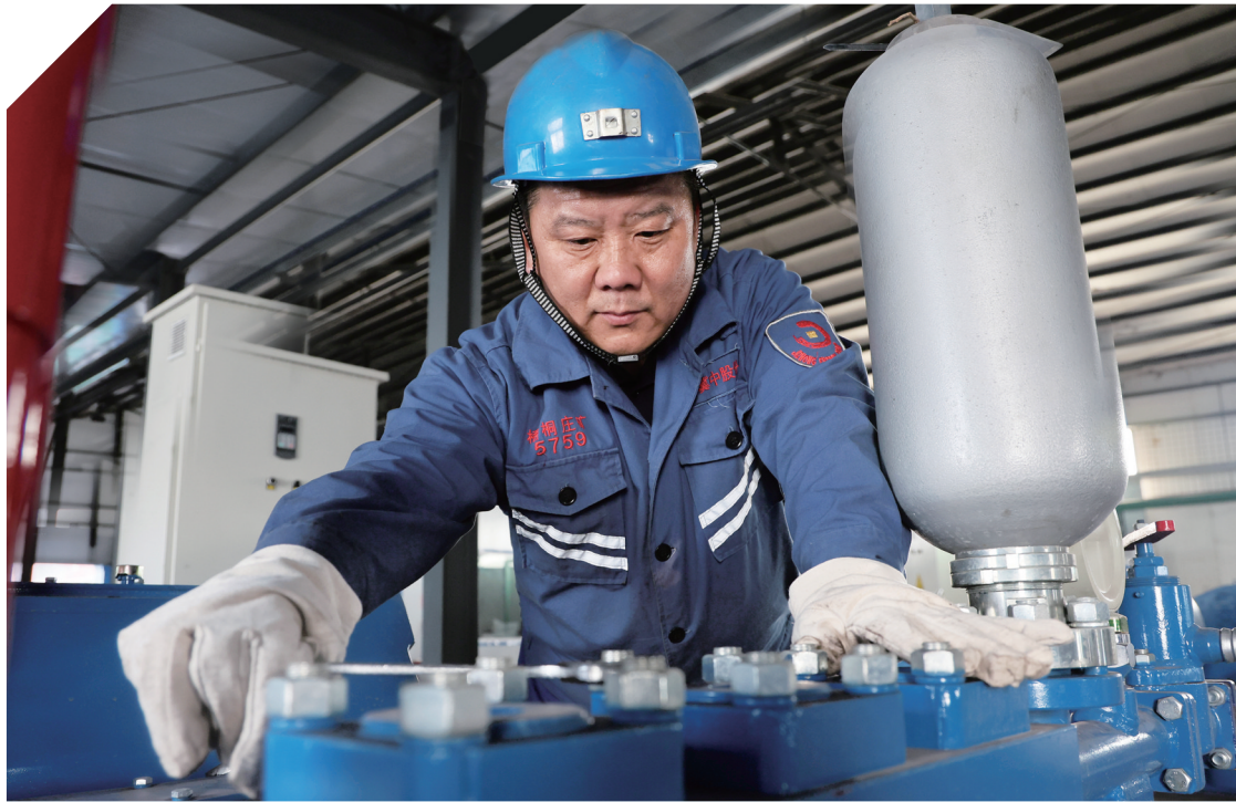
6月2日,冀中能源股份有限公司梧桐庄矿职工正在对泥浆泵进行细致排查。该矿结合夏季气候特点和生产实际,紧盯重点区域和薄弱环节,严格责任落实,细致开展隐患排查整改活动,确保夏季安全生产。

“大精煤”战略落地生金,还体现在配洗配销环节。该矿紧盯市场变化,顺市调量,充分发挥自身煤种丰富优势,开展多煤种配洗配销,根据原煤煤质动态调整配比,增加企业效益。今年以来,该矿通过配洗配销增加效益1400余万元。