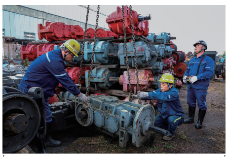
开滦东欢坨矿业公司瞄准“零事故”安全目标,全面推行设备包机制度,每周组织一次大型设备隐患排查活动,提高机电系统运转可靠性。图为该公司员工在进行设备检修。

本报讯(通讯员于彦彬)近日,河北保津高速公路公司聚焦生产一线、作业现场、设备设施、消防安全、作业流程等关键领域,开展全方位、无死角风险隐患排查,建立“排查、登记、整改、复核、销号”闭环管理台账。依托三级授课机制、岗前三分钟、专题培训、案例警示教育等多种载体,重点宣讲安全生产法规条例、岗位操作规程、重大事故隐患判定标准、汛期安全及应急自救互救等内容。强化应急预案提示,统一规范安全标识标线,作业流程公示、风险点位提示、应急疏散路线等安全目视化设置。加大“鹰眼守护”预警系统宣传推广力度,提升车辆驾驶安全。严格按照“三管三必须”原则,坚持关口前移,严格落实三级包联责任制,常态化强化督导检查。