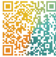
扫码看主要篇目介绍

精神,紧紧围绕党和国家中心任务,稳中求进、守正创新,坚定维护国家主权、安全、发展利益,塑造我国和世界关系新格局,把我国国际影响力、感召力、塑造力提升到新高度,不断开创中国特色大国外交新局面,为以中国式现代化全面推进强国建设、民族复兴伟业营造更有利国际环境、提供更坚实战略支撑,具有重要意义。