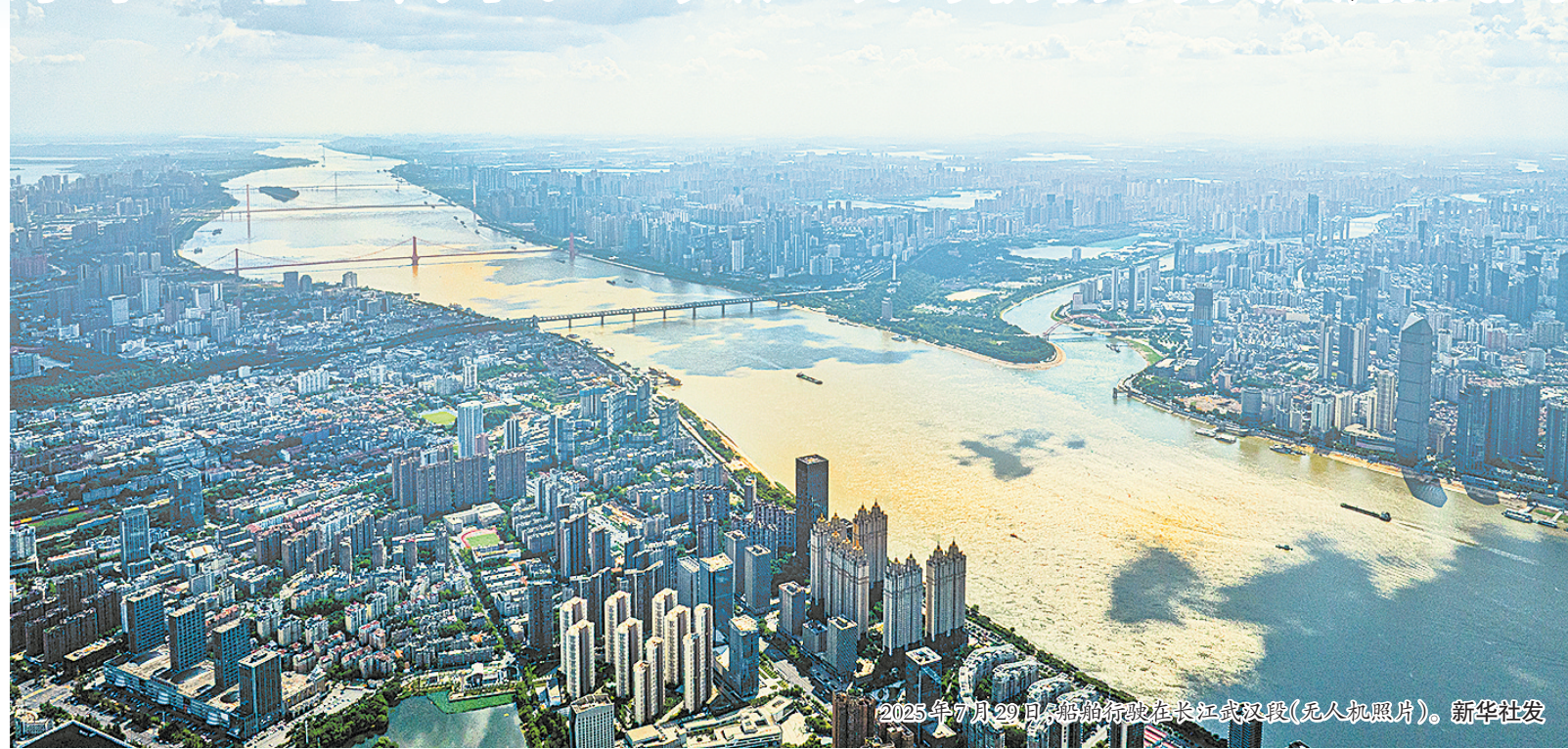
2025年7月29日,船舶行驶在长江武汉段(无人机照片)。

新华社北京6月9日电 国家“十五五”规划纲要明确,“巩固提升京津冀、长三角、粤港澳大湾区动力源作用”。作为中国经济的“动力源”,这三大区域也是地方“十五五”规划纲要中的高频词:区域内不同省份结合自身实际加强协同联动;内蒙古、宁夏等内陆地区,也凭借清洁能源等领域优势与三大区域加强协同合作。