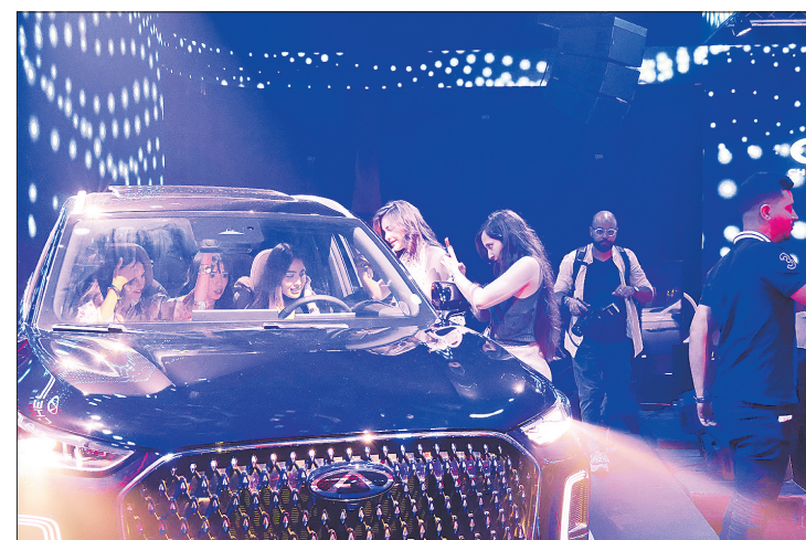
6月8日,在突尼斯首都突尼斯市举行的奇瑞新车发布会上,观众参观体验展出的汽车。中国汽车品牌奇瑞6月8日在突尼斯发布了三款混合动力车型。

据悉,工业和信息化部、国务院国资委将专项行动融入人工智能赋能新型工业化相关工作,对成效突出的区域与企业,在政策、标准、项目上予以倾斜支持;各省级工信主管部门、有关央企将通过专项资金、政府奖励支持场景开放、技术攻关、应用推广与标准研制;建立清单化管理、常态化跟踪评估机制,协调解决推进难点堵点,确保任务落地见效。