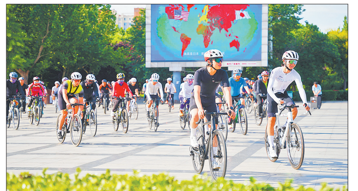
5月31日,邢台市內丘县总工会、教育局联合举办“骑行太行 康养内丘”2026年邢台市自行车联赛内丘分站赛骑行活动,100余名骑行爱好者参与。这是骑行爱好者在内丘县参加骑行活动。

总决赛最终评选产生企业决策赛道一等奖112项、企业运营赛道一等奖82项、供应链决策赛道一等奖55项、数智沙盘赛道一等奖59项、优秀组织奖74项。