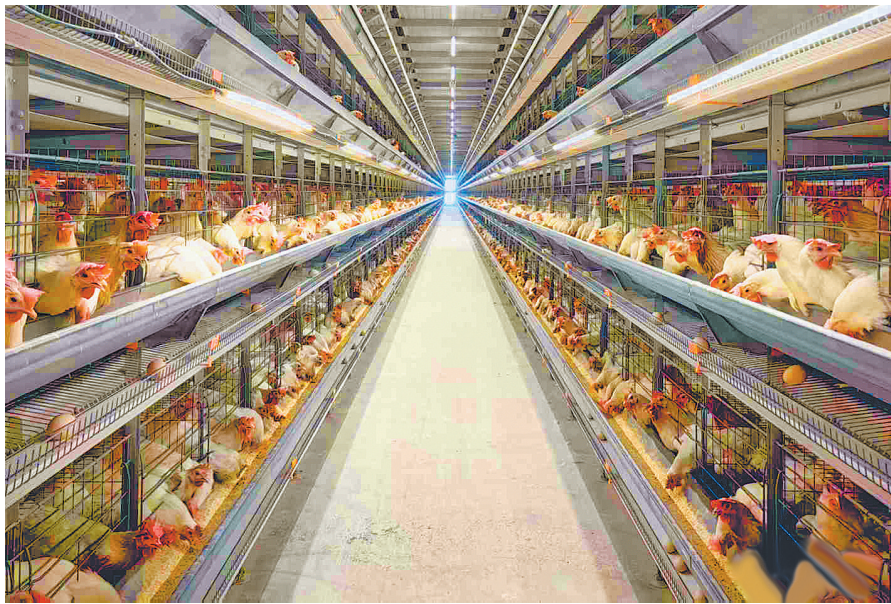
美绿思生态农牧科技馆陶有限公司全自动化鸡舍。

8.9%；而河北等10个主产省份的鸡蛋价格达9.30元/公斤，同比涨幅高达18.9%。