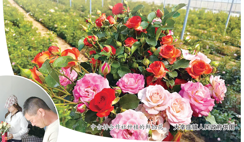
中告合作社种植的鲜切花。

五月的定州,气候温润,草木葱茏。在大辛庄镇中古村的鲜切花大棚里,推门瞬间花香扑面而来——高原红热烈,黛安娜娇粉,卡布奇诺自带复古滤镜,10多个品种鲜花挤满一棚,随手一拍就是朋友圈九宫格素材。