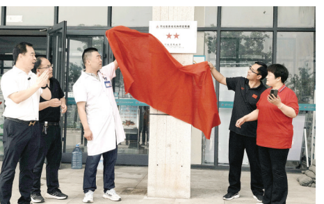
定州市清风店中心卫生院举行河北省二星级养老机构挂牌仪式。

本报讯(记者赵坤光 通讯员周永)5月24日,定州市清风店中心卫生院、叮咛店中心卫生院举行河北省二星级养老机构挂牌仪式。根据省民政厅2025年度全省养老机构等级评定公布结果,定州市福安康养老服务有限公司(清风店)医养结合中心、定州市福安康养老服务有限公司(叮咛店)医养结合中心光荣上榜。