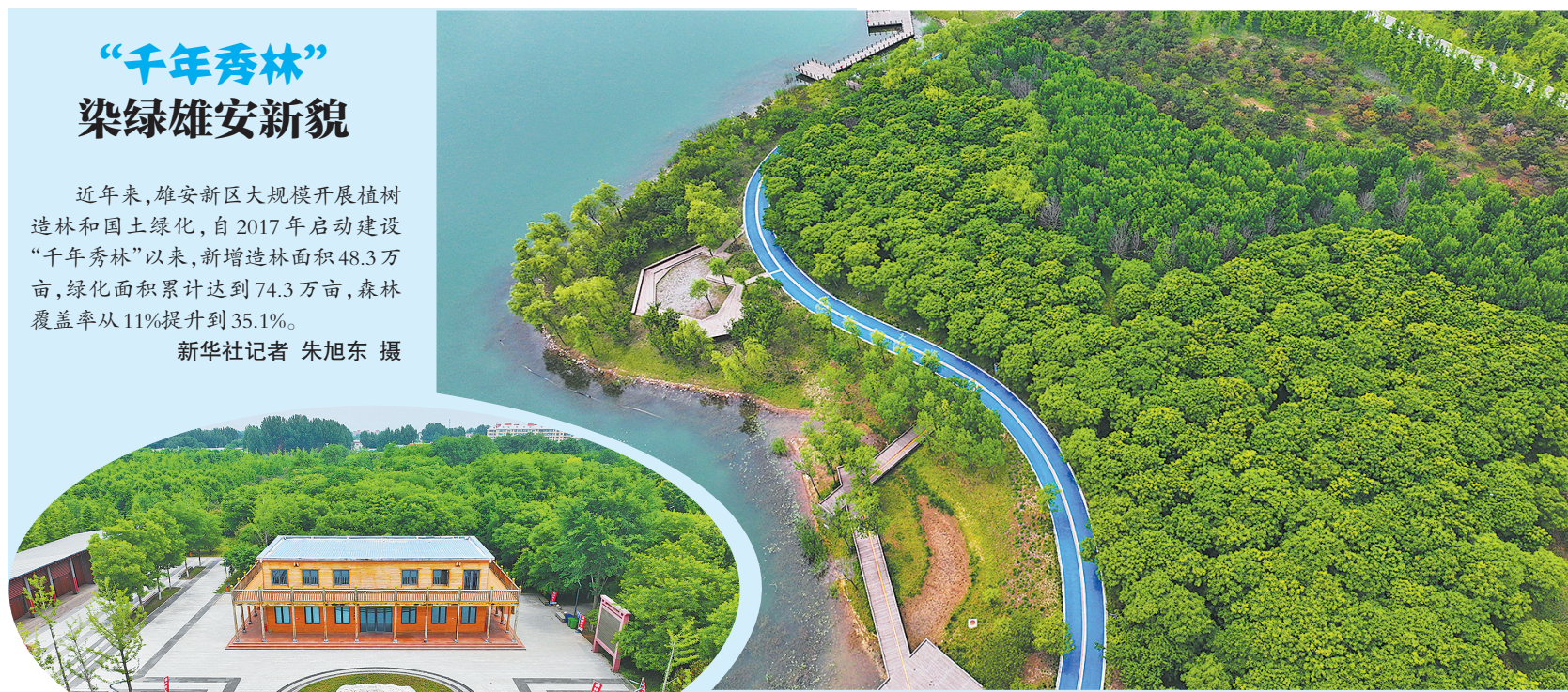
↑5月19日拍摄的雄安新区“千年秀林”(无人机照片)。