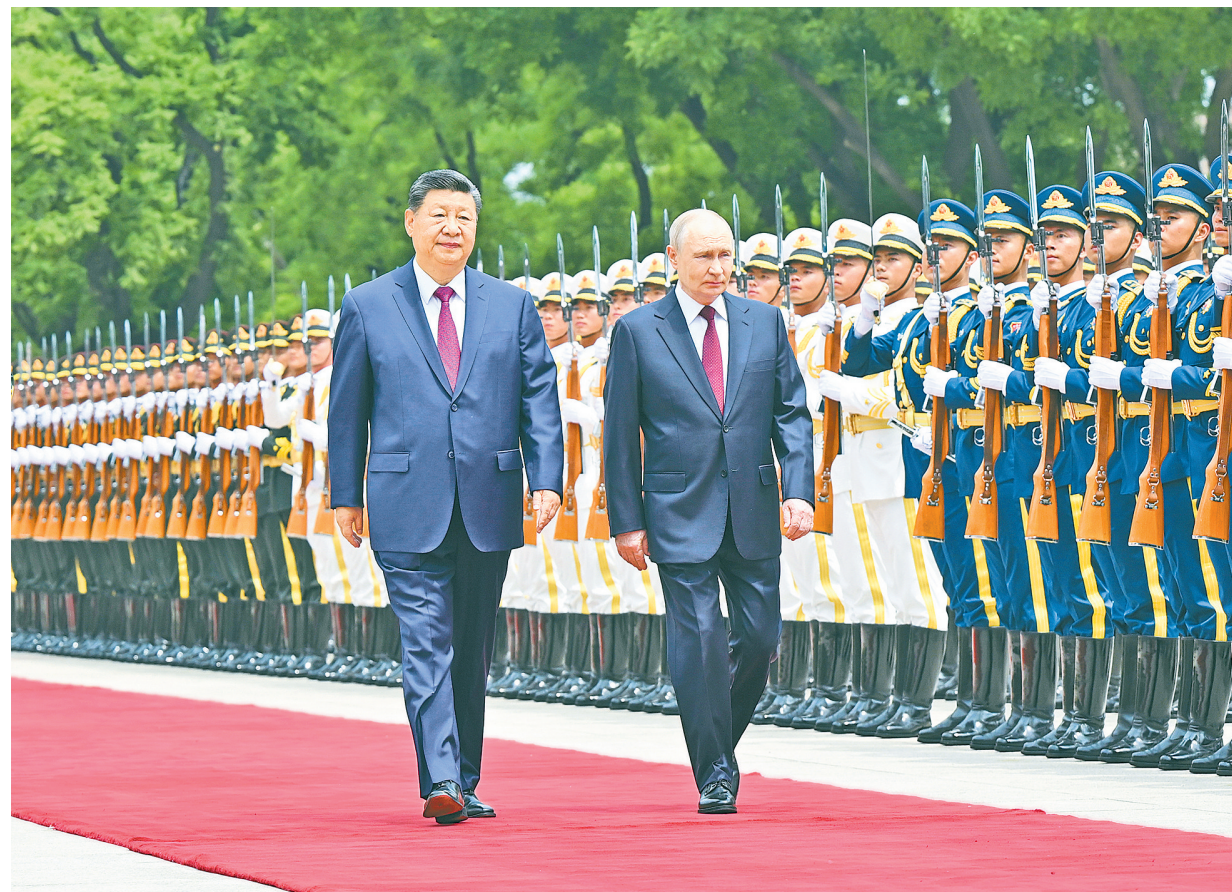
5月20日上午,国家主席习近平在北京人民大会堂同来华进行国事访问的俄罗斯总统普京举行会谈。会谈前,习近平在人民大会堂东门外广场为普京举行欢迎仪式。

新华社北京5月20日电(记者杨依军 温馨)5月20日上午,国家主席习近平在北京人民大会堂同来华进行国事访问的俄罗斯总统普京举行会谈。两国元首一致同意《中俄睦邻友好合作条约》继续延期。