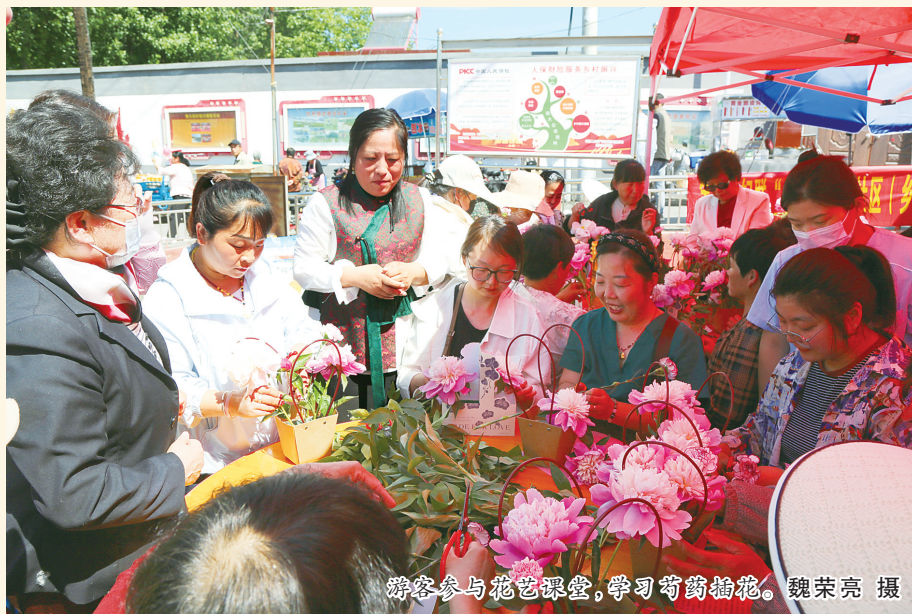
游客参与花艺课堂,学习芍药插花。

近日,保定市定兴县东落堡镇南大位村“芍药南大位 花漾乡村”第二届芍药文化节开幕。芍药园内,莎拉·麦克·春晓等多个品种的10万朵芍药竞相绽放、争奇斗艳,吸引众多游客畅游花海,或拍照打卡,或体验鲜花采摘,或品一杯本土咖啡,好不惬意!