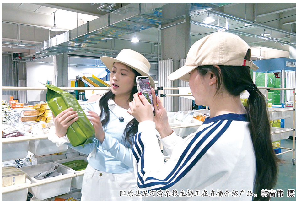
阳原县泥河湾杂粮主播正在直播介绍产品。

电商直播更倒逼企业优化生产流程,严把产品质量、提升服务水平,推动传统工业从粗放式发展向精细化、品牌化、数字化转