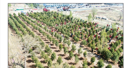
日前,张家口市塞北管理区组织开展2026年义务植树活动。植树现场全体干部职工热情高涨、干劲十足,两人一组或三五成群迅速投入植树劳动。

下一步,该区将持续开展系列工业品电商专题培训,逐步构建县域工业品电商发展体系,以数字经济赋能全区工业经济高质量发展。