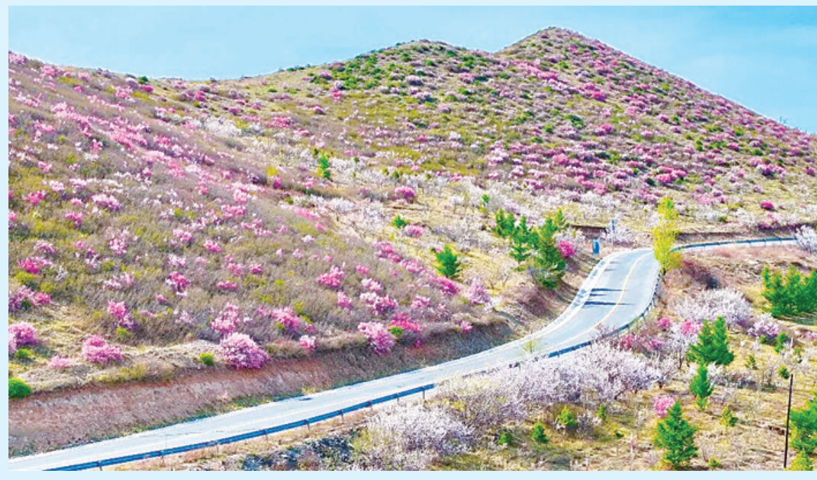
五月的坝上,张家口市尚义县麒麟山的杏花如云似雪、芬芳四溢。大青山的林海新绿初绽,蜿蜒山路在花海中铺展,蓝天白云,风清气明。图为尚义县大青山景色。