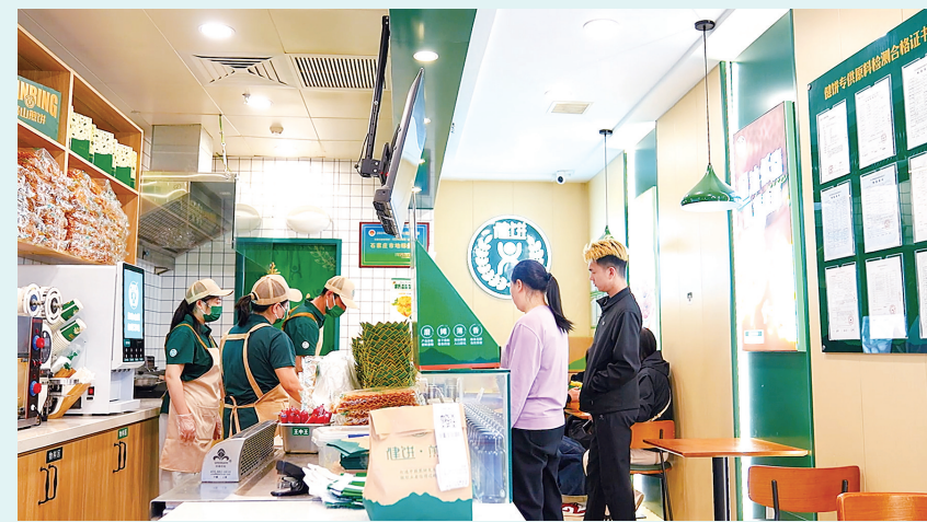
工人在煎饼薄脆生产线整理薄脆。

2019年,已是企业负责人的高伟栋,做了一个令很多人费解的决定:将煎饼的核心原料加工基地,从城市搬回了交通不便的测鱼村。