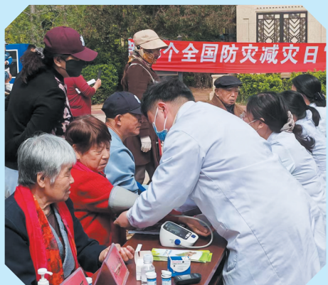
秦皇岛市红十字会、市气象局等15家市防灾减灾成员单位全方位普及各类灾害防范知识、逃生避险技巧与自救互救实用技能。