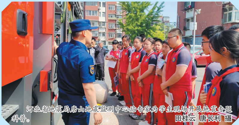
河北省地震局唐山地震监测中心站专家为学生现场开展地震命题科普。

今年5月12日是第18个全国防灾减灾日,主题是“人人讲安全、个个会应急——提高防灾减灾救灾能力”,5月11日至17日为防灾减灾宣传周。我省各地积极普及防灾减灾知识和技能,举办系列集中宣传活动,营造了全社会共同关注、共同参与防灾减灾的良好氛围。