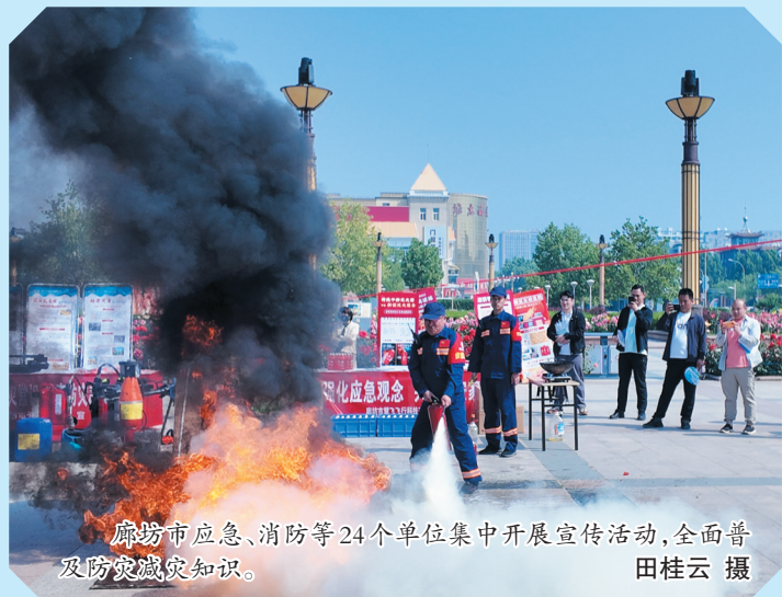
廊坊市应急、消防等24个单位集中开展宣传活动,全面普及防灾减灾知识。