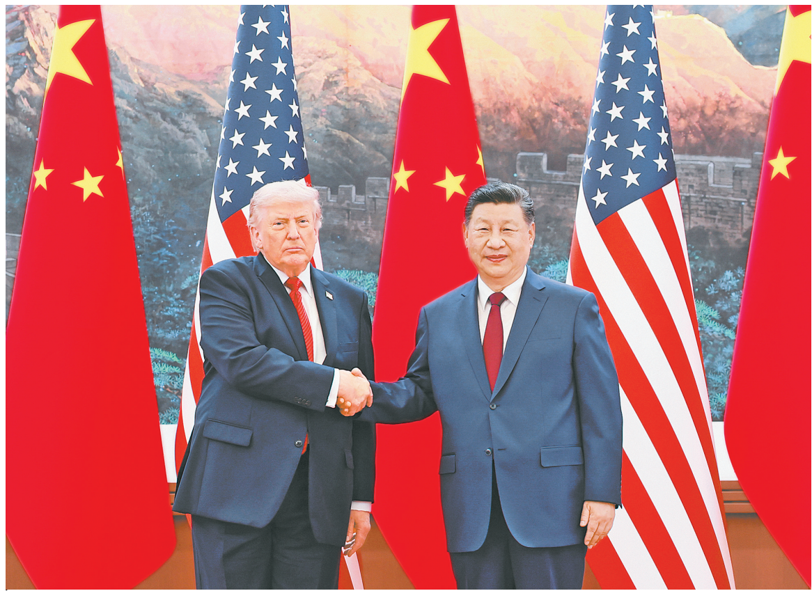
5月14日上午,国家主席习近平在北京人民大会堂同来华进行国事访问的美国总统特朗普举行会谈。