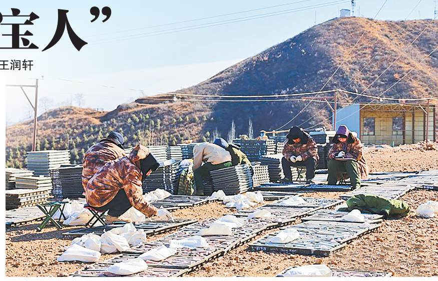
工作人员在进行岩心采样。

截至目前，该矿区外围新增金资源量达大型规模，使整个金矿区矿床规模跃升至特大型（金资源量≥50吨），且区域深部仍有广阔找矿空间，未来预计可达到超大型（金资源量≥100吨）。这一成果不仅提振了冀西北地区找矿信心，