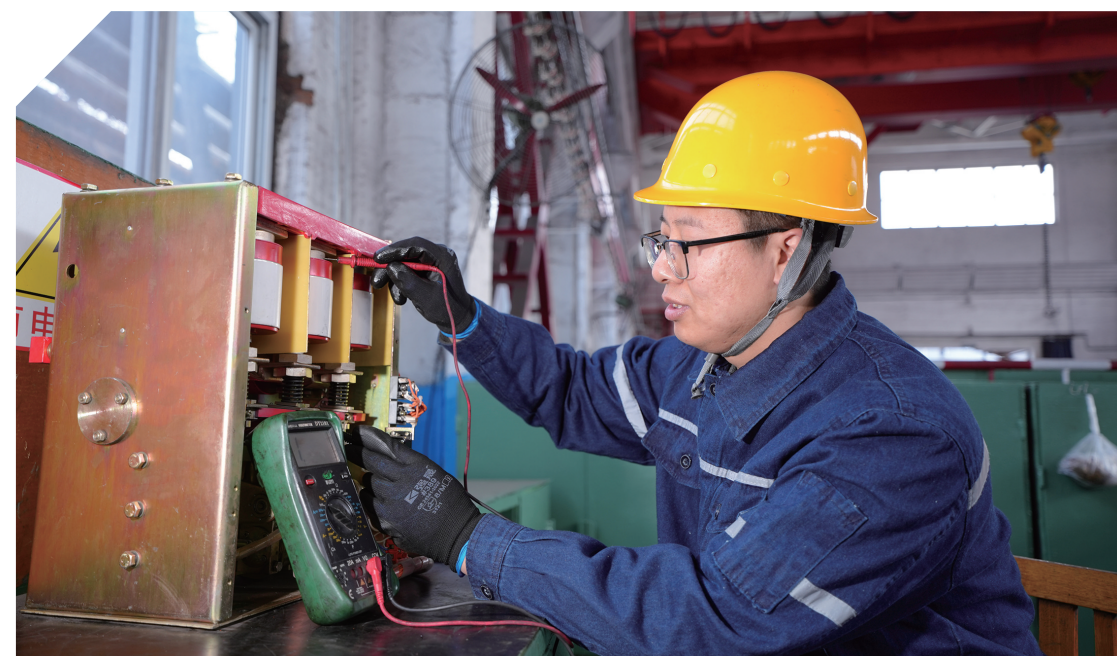
近日，开滦集团钱家营矿业公司以“成本管控提升年”为契机，组织青年员工开展废旧设备修复专项攻坚行动，带动全员养成精打细算、厉行节约的良好习惯，为企业降本增效注入青春动能。图为该公司青年员工在对井下回收的设备元件进行维修。

本报讯(通讯员马冰 郭梓田)4月28日，中建路桥集团物业管理分公司团支部组织青年志愿者，前往正定县东叩村祥和养老院，开展敬老爱老志愿服务活动。志愿者们带着牛奶、米稀等生活用品看望了院里的困难老人，并拿起扫帚、拖把，把院落、走廊、活动室打扫得干干净净。近三年，中建路桥集团物业管理分公司青年志愿者累计开展关爱留守老人、义务植树、环境整治、高考爱心护航、无偿献血等各类志愿服务活动30余次，超250人次青年志愿者踊跃参与。