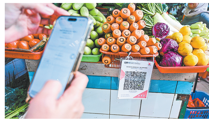
4月30日,在印度尼西亚万丹省南唐格朗,一名顾客扫码付款。印度尼西亚银行(印尼央行)4月30日宣布,印尼二维码标准支付系统(QRIS)已与中国二维码支付体系实现互联互通,两国消费者可通过各自常用支付平台在大部分跨境零售场景下扫描二维码完成支付。