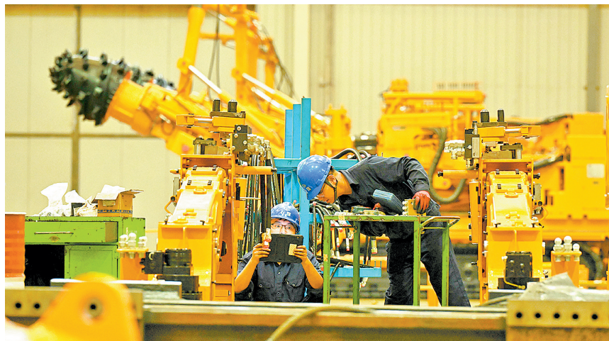
2025年10月9日，在河北石家庄装备制造产业园，技术人员在石家庄煤矿机械有限公司装配车间组装装备。