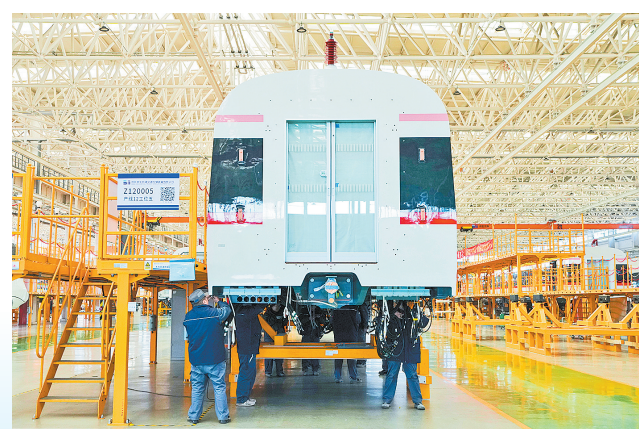
在京投资装备河北北京车智能制造基地，工作人员在地铁列车总装车间内工作(2025年2月14日摄)。