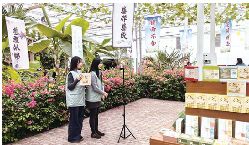
青年主播们在共享直播间直播带货。

4月17日,魏县潮品跨境电商产业园邀请阿里巴巴国际站邯郸区域跨境电商专家韩涛等一行,对全县有开展跨境