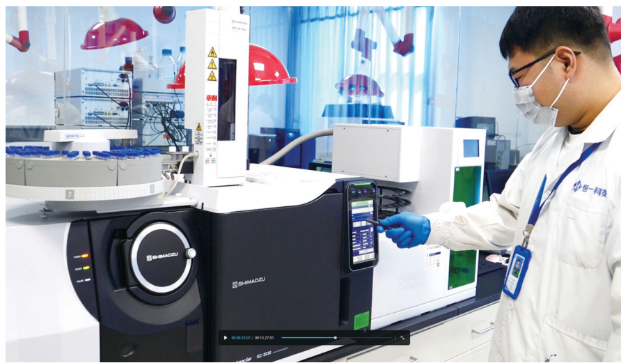
河北恒一联成特种检测设备检测股份有限公司工作人员在做设备检测。记者 孟维伦 摄

“共享智造”不仅降低了企业成本,更推动了产业集群整体提质增效。目前,邯郸市已谋划推进“共享智造”项目63个,建成共享项目35个,覆盖18个县(市、区)的27个产业