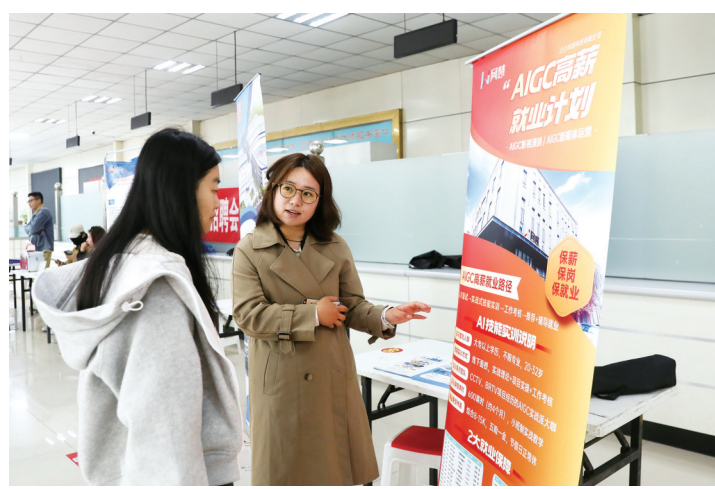
大厂回族自治县2026年春季零工市场专场招聘会现场。

近年来,大厂回族自治县聚焦优化营商环境、打造就业招聘服务品牌,强化精准对接,突出抓好失业青年、就业困难人员等重点群体就业促进和服务工作,不断提升高质量就业水平。“我们将聚焦就业招聘服务提质增效,紧盯经营主体和群众的实际需求,不断创新服务模式、拓展服务渠道、优化营商环境,推