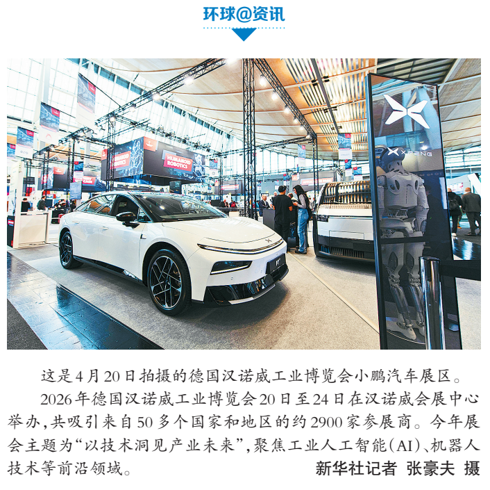
这是4月20日拍摄的德国汉诺威工业博览会小鹏汽车展区。2026年德国汉诺威工业博览会20日至24日在汉诺威会展中心举办,共吸引来自50多个国家和地区的约2900家参展商。今年展会主题为“以技术洞见产业未来”,聚焦工业人工智能(AI)、机器人技术等前沿领域。

新华社北京4月20日电(记者王聿昊)记者20日从中国民航局获悉,今年3月份,民航旅客运输量6663.2万人次,同比增长12.1%。中国民航局当日公布民航3月份主要生产指标统计数据。数据显示,3月份,民航国内航线旅客运输量5951.1万人次,同比增长11.5%;国际航线旅客运输量712.1万人次,同比增长17%。 货邮运输方面,3月份,民航货邮运输量85.1万吨,同比增长4.2%。其中,国内航线货邮运输量45.8万吨,同比增长1.3%;国际航线货邮运输量39.3万吨,同比增长7.8%。