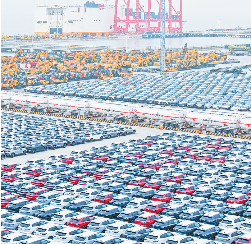
这是2026年3月20日在江苏太仓港汽车码头堆场里拍摄的准备运输出海的商品车(无人机照片)。

带一路”共建国家的客户络绎不绝。这家企业给出的不是简单的储能柜,而是“EPC总包+本地化团队+电力交易解决方案”的系统服务。针对欧洲电网不稳、电价波动波动的特点,他们自主研发了能适配分钟级电力交易的小型智能储能柜,实现了“低充高放”的灵活用电模式。针对非洲柴油成本高企的困境,推出“光储柴”一体化系统,仅需一年半到两年即可帮助客户收回成本。