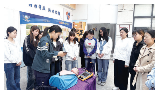
县医院急诊科医生向参训人员示范急救技巧。

本报讯(记者张隽 通讯员田雨雪 袁赫森)4月15日,曲周县妇联联合县红十字会、县医院在北正职业培训学校,为当地“河北福嫂”家政服务人员开展专项急救知识培训。