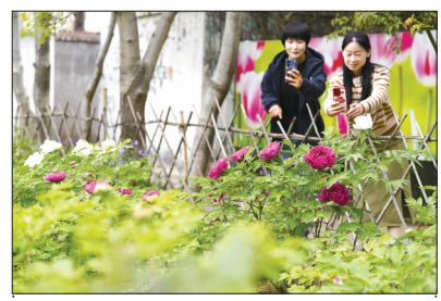
日前,广平县各大公园里牡丹盛开,红粉白紫交织成海,花香四溢。市民纷纷走进花海,拍照打卡、悠闲漫步,在春日暖阳里沉浸式体验“国色天香”。图为市民在赏花拍照。

下一步,束馆镇计划在冢北村流转150亩土地,全力打造番茄产业园,进一步推动蔬菜产业规模化、品牌化发展,带动更多农户增收。同时,该镇正积极对接边境贸易渠道,计划将本地优质西红柿、西瓜、无丝豆等蔬菜产品推向国际市场,推动“小束菜”走向国门、走向世界,持续提升产业竞争力,为乡村振兴注入强劲动力。