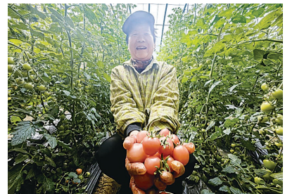
在大名县束馆镇家北村的大棚内,农户在展示刚采摘的西红柿。

本报讯(记者张隽 通讯员谷聪聪)近年来,大名县束馆镇依托冀鲁豫三省交界的区位优势,大力发展设施农业,以产业兴旺赋能乡村振兴,推动蔬菜产业向规模化、品牌化、国际化方向发展。