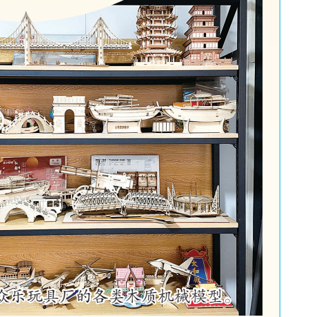
众乐玩具厂的各种木质机械模型。

众乐玩具厂的探索,是魏县“一品一播”赋能基层、激活乡村产业的一个生动缩影。他们通过行动证明,小厂也有大市场。