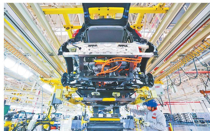
1月8日,在奇瑞新能源汽车股份有限公司石家庄分公司总装车间,员工装配新能源汽车。

“这充分体现了质量强国在经济社会发展中的基础性、战略性地位。”中央党校(国家行政学院)教授蔡之兵表示,我国经济已由高速增长阶段转向高质量发展阶段,将质量强国上升为国家战略,对于进一步转变发展方式、优化经济结构、转换增长动力、推动我国经济由大向强转变,具有重要意义。