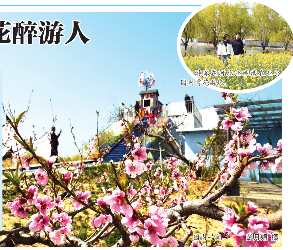
游人在河北亚滦湾农业公园内赏花游玩。

近年来,迁安市坚持“文旅+百业”“百业+文旅”的发展思路,构筑“滦河一号公路”旅游环线,深入做好旅游与赛事、工业、研学、演艺等融合文章。积极融入长城国家文化公园建设,打造总长49.5公里的北部长城山野绿道,实施“文旅+数字”项目,推动文旅产业高质量发展。