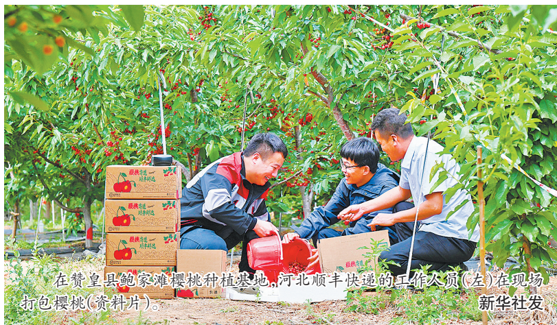
在赞皇县鲍家滩樱桃种植基地,河北顺丰快递的工作人员(左)在现场打包樱桃(资料片)。

个品种,林果种植面积突破110万亩,建立三大产业基地,包括45万亩大枣、40万亩核桃,以及5万亩特色果品如板栗、樱桃和苹果等。林果业总产值达到28亿元,带动农民人均年增收2400元以上。