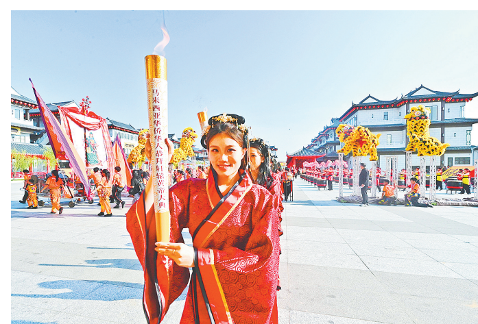
这是4月12日在马来西亚雪兰莪州拍摄的马来西亚华人恭拜轩辕黄帝大典活动现场。当日,丙午年马来西亚华人恭拜轩辕黄帝大典在马来西亚雪兰莪州举行。