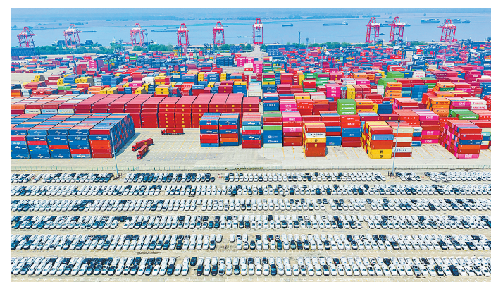
这是4月10日在江苏省港口集团南京龙潭港区拍摄的等待远销的汽车(无人机照片)。中国汽车工业协会4月10日发布数据显示,2026年3月,我国汽车产销分别完成291.7万辆和289.9万辆,环比分别增长74.4%和60.6%。其中新能源汽车产销量分别为123.1万辆和125.2万辆。

据新华社电(记者徐社)2026年5月19日是第16个“中国旅游日”。文化和旅游部办公厅4月10日发布通知,确定“5·19中国旅游日”活动主题为“乐享品质旅游,共赴美好山河”,活动时间为4月23日至5月31日。 根据通知,5月19日,文化和旅游部将在广东省广州市设立主会场。其余省(区、市)(含新疆生产建设兵团)设立分会场,围绕2026年主题结合地域特色开展系列活动。 此外,各地还将举办包括文化和旅游惠民活动、品质服务提升活动、入境旅游推介活动、文明安全旅游活动、宣传推广活动在内的主题月系列活动。