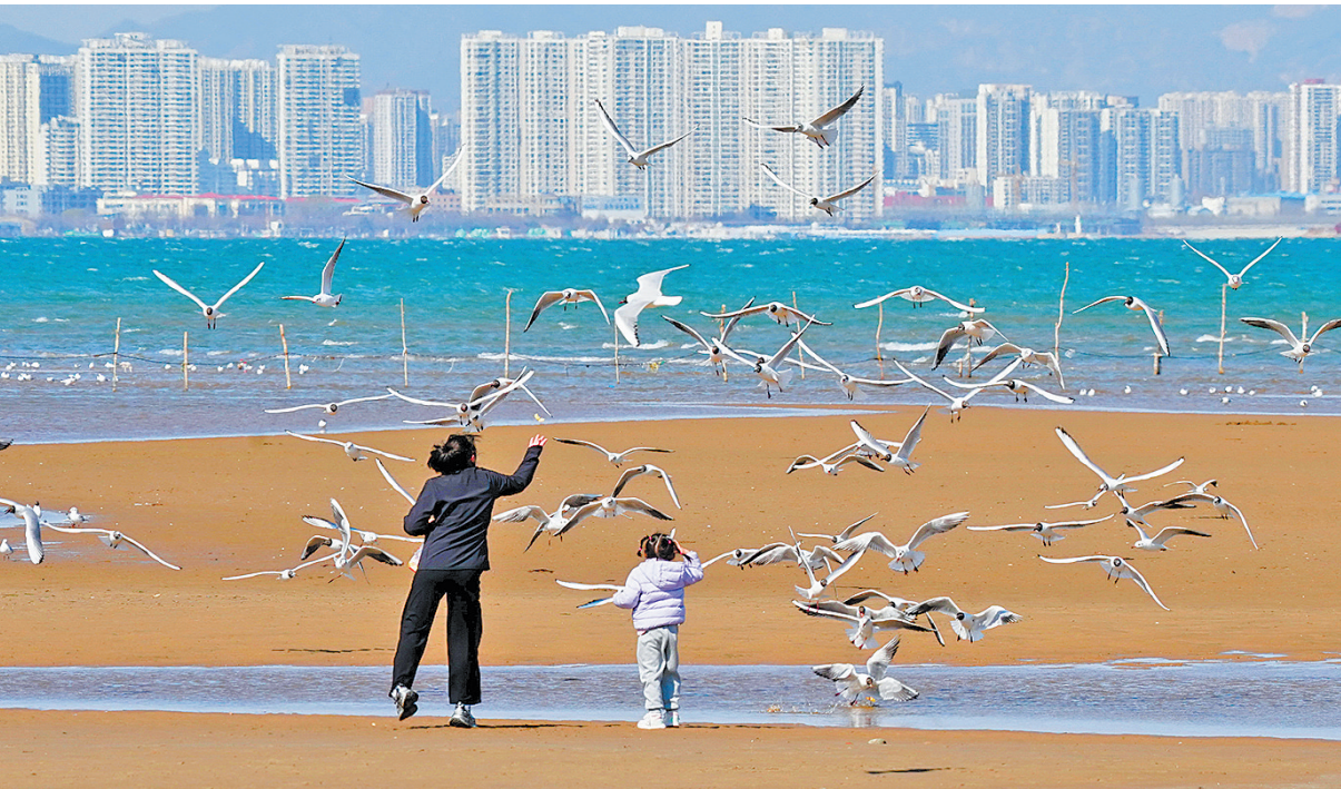
秦皇岛:海鸥翩翩起舞