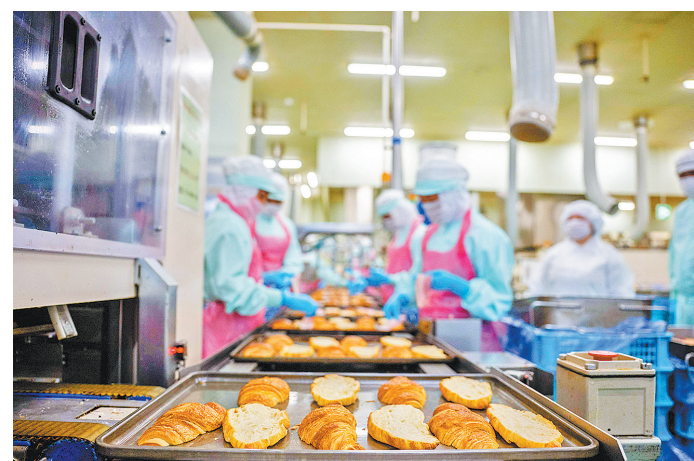
这是4月7日在日本东京都昭岛市一家烘焙厂内拍摄的面包。日本总务省7日公布的调查结果显示,由于通货膨胀持续高企令民众实际可支配收入受到挤压,今年2月,日本实际家庭消费支出连续第三个月同比下滑。

(上接第一版)既能够支撑智能网联汽车、低空经济以及自然资源灾害监测各领域应用;也能够深入我们的日常生活,让共享单车可以有序停放,让物流外卖可以实时追踪。除此之外,它还具有时空大数据业务,包含地图、测绘、遥感、轨迹、活动等各类数据,是新质新域应用、产业数字化转型的“底层燃料”,让时空数据真正流动起来,释放应用价值。