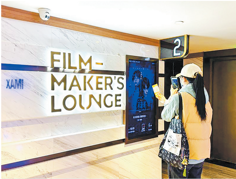
观众在影厅外拍照打卡。