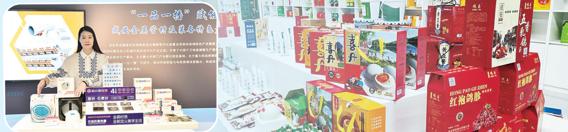
成安县“一品一播”产业园区主播在进行产品介绍。

本报讯(记者张隽 通讯员郭晓月 武成军)在成安县,车间与云端相连,田间与市场直通。手机这方小小屏幕,正成为撬动全域变革的支点,一场传统工业强县数字经济“变形记”正在上演。