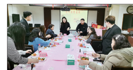
3月14日,农行古冶支行联合太平洋保险举办私人客户香薰手作主题活动,在轻松氛围中开展家族信托专题分享,深化客户沟通。

本报讯(通讯员郭燕飞)近日,农行滦南支行组织开展规范使用人民币图样集中宣传活动。该行向群众讲解人民币作为我国法定货币的严肃性,明确非法印制、销售、使用“人民币版”冥币等行为的违法性;重点倡导文明祭祀理念,引导群众远离“人民币版”冥币。