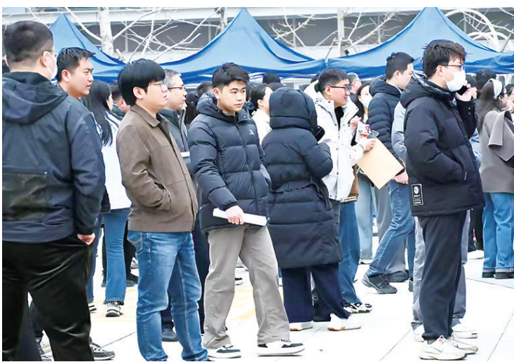
雄安新区服务疏解专场招聘会 企业招聘区

作为北京非首都功能疏解集中承载地,雄安新区始终围绕打造新时代宜居宜业的人民之城,把做好疏解单位就业服务保障作为重点工作,持续完善就业服务体系,精准对接各类群体就业需求,通过举办专场招聘会、开展直播带岗等形式,打通就业服务“最后一公里”,构建线上线下