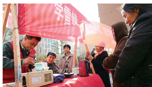
志愿服务月活动现场。

本报讯(通讯员牛亚兵)近日,国家电网河北电力(雄安)共产党员服务队(以下简称“服务队”)联合容东兴安社区、河西社区,共同启动“学雷锋、做志愿、赶考奋进十五五”志愿服务月活动,以实际行动践行雷锋精神,守护群众用电安全。