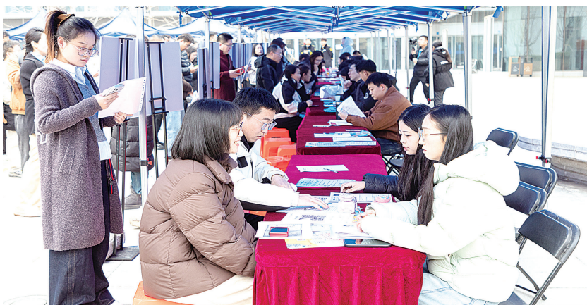
活动现场。 启动区管委会供图