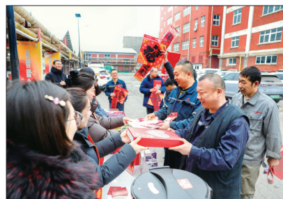
近日,开滦集团唐山矿业公司将节日氛围营造与安全生产工作深度融合,组织开展一系列喜闻乐见的迎春暖心活动,为新一年的安全生产开好局、起好步奠定了坚实基础。图为该公司在开展迎春新春抽奖活动。

去年以来,欢矿公司全力打造精品示范工程,树立了“干一项工程,出一个精品”的理念,制定了各专业详细达标规划,确保从采面掘进、安装开始不做返手活,以标准化保工期、保衔接、保正规循环作业。同时,公司还先后组织了安全自主管理等现场会,有效发挥了激励先进、鞭策后进、推进整体的作用。