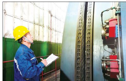
近期,开滦股份吕家坨矿聚焦设备安全可靠运行,组织员工全面开展设备检修维护工作,为实现高起步、开门红提供有力保障。图为该矿机电科起重班员工在查验提升设备完好情况。