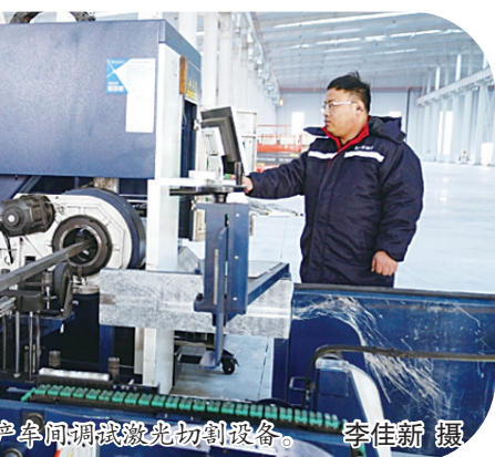
工人在生产车间调试激光切割设备。

式,极大缩短手续办理时间。服务小组定期深入工地现场,了解项目遇到的问题难题,并协调沟通行政审批局、城乡建设委员会、生态环境局、电力公司、水务公司等职能部门,高效破解审批许可、场地平整、用水用电等10余个关键问题。 2025年1至11月份,全区实现固定资产投资增长13.4%;累计实现开工项目111个,其中,5000万元以上产业项目40个,5亿元以上项目9个。 “秦皇岛经开区高度重视招商引资、项目建设,作为项目包联单位,我们在项目建设中及时沟通各相关部门,协调联动,共同解决问题,促使项目从开工到竣工只用了100天时间,体现了经开区建设速度。下一步,我们将为企业提供更好的包联服务,助力全区经济社会高质量发展。”秦皇岛经开区民生保障局局长庞爱民说。 在项目建设中,秦皇岛经开区还创新实施了项目竣工“预验收”模式,提升建设效率。区城建委在项目取得施工许可证后即向参建单位进行技术交底,根据工业厂房建设图纸、技术指标、安全生产等实际情况,对验收内容、组织形式、监督方式等