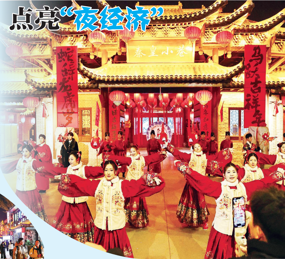
▲游客在海港区秦皇小巷游玩打卡。

本报讯(曹建雄)近日,海港区秦皇小巷内人头攒动、热闹非凡,许多游客穿梭其间逛特色集市、赏精彩演出、品地道美食,升腾的烟火气扑面而来。一幅“夜有所乐、乐有所消”的文旅新图景正徐徐铺展,既为城市注入蓬勃的经济动能,更让城市“夜经济”焕发出别样活力。 近年来,海港区立足本地实际,不断丰富多元化文旅供给,持续激活文化和旅游消费潜力,在满足群众放松休闲需求的同时,也为地方经济发展增添强劲动力。