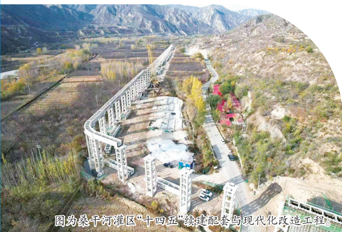
图为桑干河灌区“十四五”续建配套与现代化改造工程。

谋近亦谋远。涿鹿县立足县情水情,科学擘画“十五五”水利蓝图,围绕农村管网提升、集中供水、灌区改造、防洪减灾、河道修复等关键领域,精心谋划了10个重大项目,总投资规模约33.77亿元。这些项目如同一