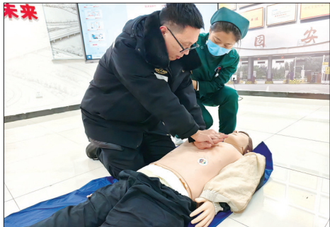
日前,河北高速大广分公司南宫应急大队衡水分点与衡水市第五人民医院联合开展急救知识实训,通过“理论讲解+实操演练+情景应用”的方式,向应急队员讲解演示心肺复苏、创伤包扎、使用自动体外除颤仪等急救技能,增强全员急救意识,提升应对突发事件的处置能力。图为应急队员利用人体模型进行实操演练。

本报讯(通讯员谷海涛)12月14日,由衡水市人力资源和社会保障局、桃城区人力资源和社会保障局指导,桃城区中华大街街道办事处与衡水市人力资源服务行业协会联合主办的社区专场招聘会举行。 本次招聘会聚焦高校毕业生、退役军人、农民工等重点群体就业需求,同时面向各类求职人员,吸引涵盖机械制造、商贸服务、新能源、互联网等多个领域的优质企业参会,涉及行政管理、市场营销、普工技工等多个类别,既包含面向专业人才的高薪优岗,也有适合新手入门的基础岗位,充分满足不同层次求职者的就业诉求。 衡水市人力资源服务行业协会带领并协同冀聘人才网,充分发挥行业桥梁纽带作用,依托自身资源优势,精准对接本地重点企业与优质用人单位,采用“线上+线下”融合模式,一方面设立服务台,帮助企业与求职者解决难题、助力双方快速匹配;另一方面开通线上直播带岗通道,同步直播招聘会盛况,详细介绍企业概况、岗位要求及薪资福利,让未能到场的求职者实现“云端求职”,线上直播累计观看人数超2万人次,本次招聘会共提供了320余个岗位,求职人数达2500余人次,累计收到简历600余份,初步达成就业意向860余人。