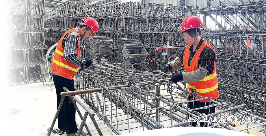
工人正在制作预制墙板。

术,房屋整体结构强度高,抗震、防风性能优越。同时,在隔音、保温等方面也表现优异,为广大农民群众“安居”“乐居”提供了多元选择。 “整个过程省心省力,专业公司负责设计到施工的全过程,严格的标准让质量有了保障。节能效果也很明显,冬暖夏凉,建房成