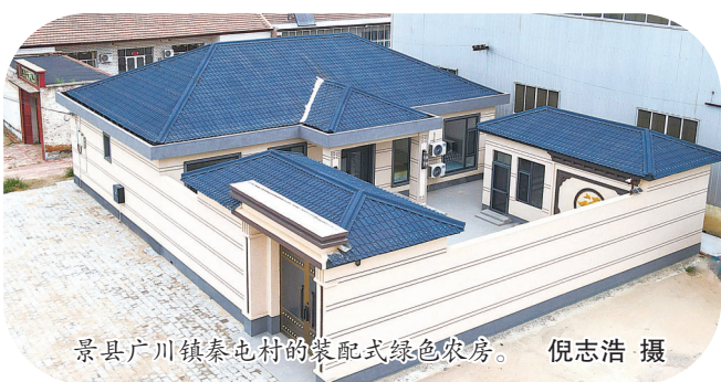
景县广川镇秦屯村的装配式绿色农房。

本报讯(通讯员高雷 郑蕊 张梦娟)衡水市景县大力推广装配式绿色农居,以“政府引导、企业参与、农户受益”的创新模式,将“像搭积木一样造房子”的现代建筑理念引入农村,有效提升了农房的安全性与舒适度。 在景县广川镇秦屯村,一栋米白色墙面搭配棕色屋檐的新型农房格外引人注目。这栋房屋不仅外观现代大气,其建造过程更是高效便捷,从开工到主体结构完成仅用了十几天时间,远远短于传统农房数月的建设周期。 与传统建造方式相比,装配式绿色农居具有显著优势。所有构件均在工厂预制完成,质量严格可控,施工更加标准化、规范化。通过构造柱、高强度灌浆套筒等先进技