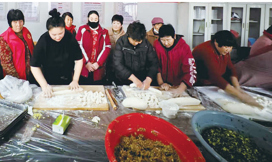
柴庄村村民冬至包饺子。

本报讯(记者霍文龙 通讯员卢文彬 王立菲)在冬至到来之际,馆陶县开展包饺子、剪纸等系列活