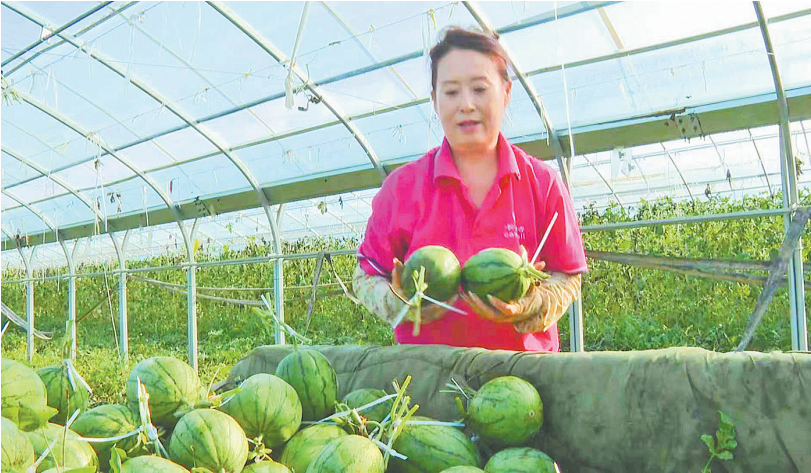
瓜农在大棚采摘、搬运西瓜。

大棚模式调整,资金赋能撑起“钢铁瓜棚”。为提升瓜棚的抗灾能力与生产效率,清苑区争取超长期特别国债资金6360万元,补贴支持西瓜棚室更新改造提升,已完成300亩西瓜棚室改造。同时,出台《保定市清苑区新建改建西瓜棚室贷款贴息方案(试行)》,对2025年1—12月新建、改建西瓜棚室的贷款,连续贴息3年,积极推动传统竹木结构大棚向现代化钢架