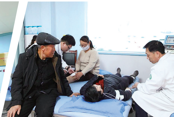
患者在潞灌镇卫生院接受康复治疗。