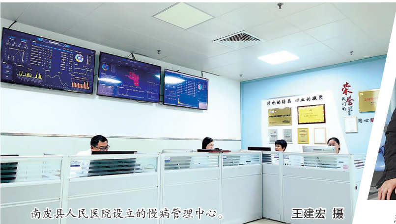
南皮县人民医院设立的慢病管理中心。