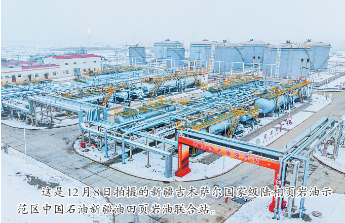
这是12月8日拍摄的新疆吉木萨尔国家级陆相页岩油示范区中国石油新疆油田页岩油联合站。

据新华社乌鲁木齐12月9日电(记者顾煜)中国石油集团12月9日发布消息,我国首个国家级陆相页岩油示范区——新疆吉木萨尔国家级陆相页岩油示范区今年原油产量突破170万吨,标志着其国家级示范工程建设任务全面完成。