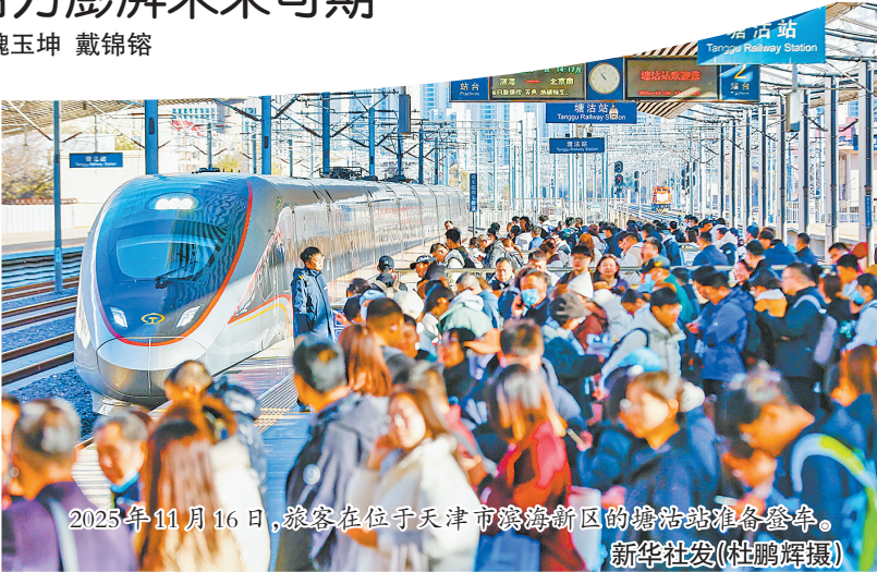
2025年11月16日,旅客在位于天津市滨海新区的塘沽站准备登车。